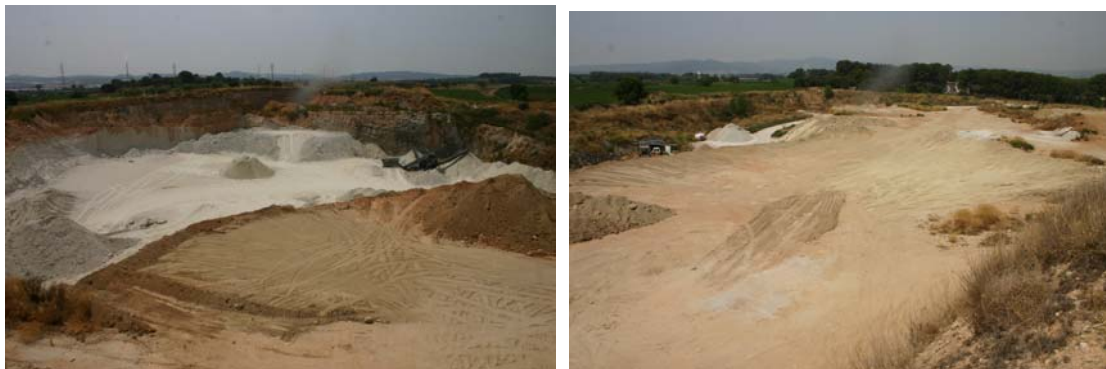
Fotos nº104 i nº105. Vista de l'activitat Antònia, situada al sud del casc urbà.

Aquesta activitat està relativament propera al nucli dels Boscos del Priorat, i a l'ermita del Priorat de Banyeres, però la seva configuració, enclotada respecte a aquests espais i protegides les visuals des del nucli i des del camí asfaltat dels Boscos del Priorat a l'ermita del Priorat per una mota de terra, permet tenir un impacte paisatgístic relativament assumible i controlat. Bona part de la cubeta ha estat reblerta amb terres.