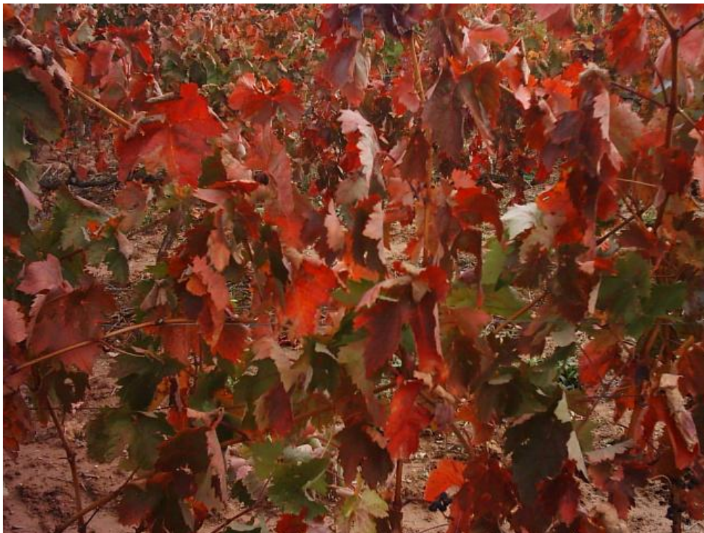
Foto nº101. La vinya és el conreu majoritari del municipi.

Cal analitzar també l'evolució dels conreus més importants en els darrers anys -els tres censos existents-, la qual es presenta en la taula i gràfics següents: