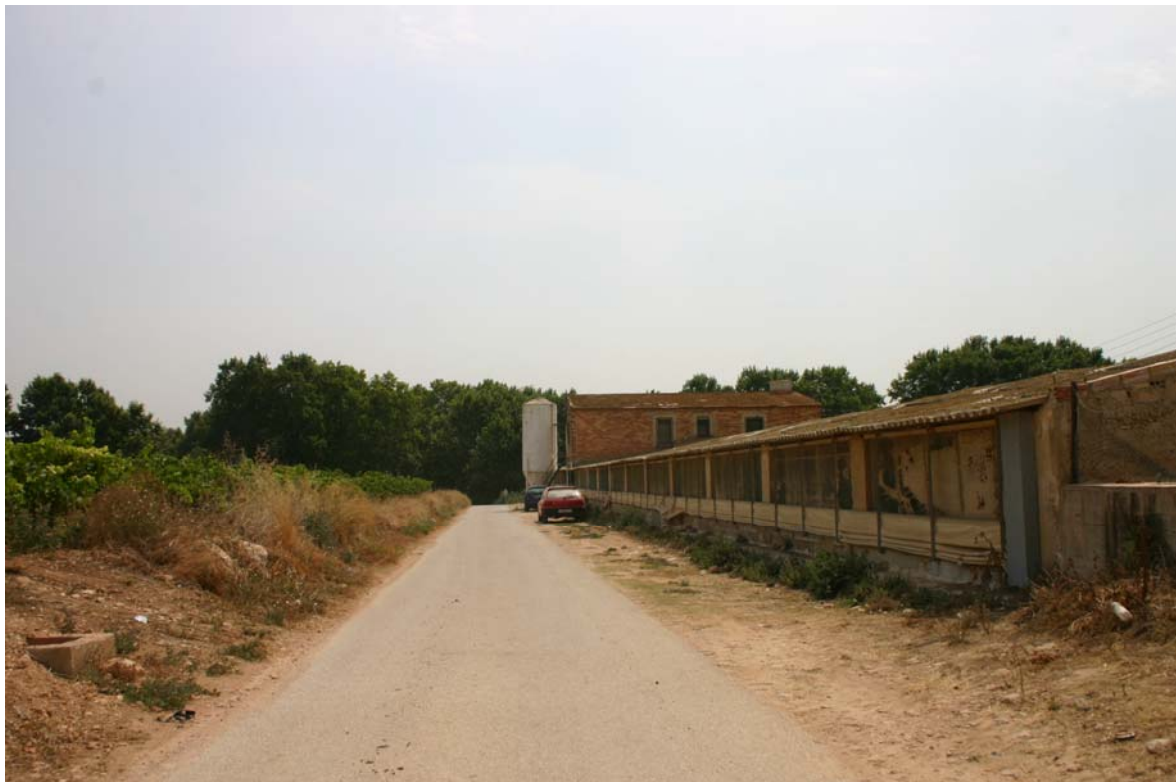
Foto n°103. Imatge d'una gran nau avícola entre el nucli de Casa Roja i el de Sant Miquel

Per tant, es pot concloure que l'activitat ramadera té una importància considerable al municipi, especialment el sector avícola, tot i els problemes de rendibilitat i de continuïtat d'algunes de les explotacions.