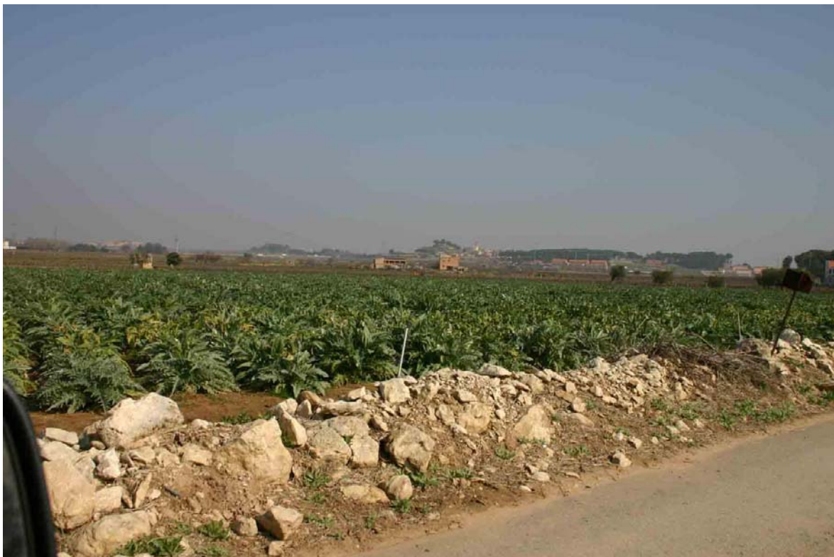
Foto nº102. Horta intensiva amb carxofes prop del mas Jover

Tot i així, en els darrers anys s'ha vingut experimentant una creixent transformació de paratges de secà a explotacions hortícoles intensives en reg gota a gota. Una empresa anomenada Fruit Camp ha estat treballant intensament en transformacions de conreus, qüestió que ha produït certa preocupació tant per part de l'ajuntament com per part dels pocs pagesos locals, tant pels impactes paisatgístics com per l'augment de les extraccions d'aigua d'aquífer. Si al cens de 1999 les hectàrees considerades d'hortalissa en reg eren 7, no es tenen estimacions actuals però de ben segur la xifra s'ha multiplicat.